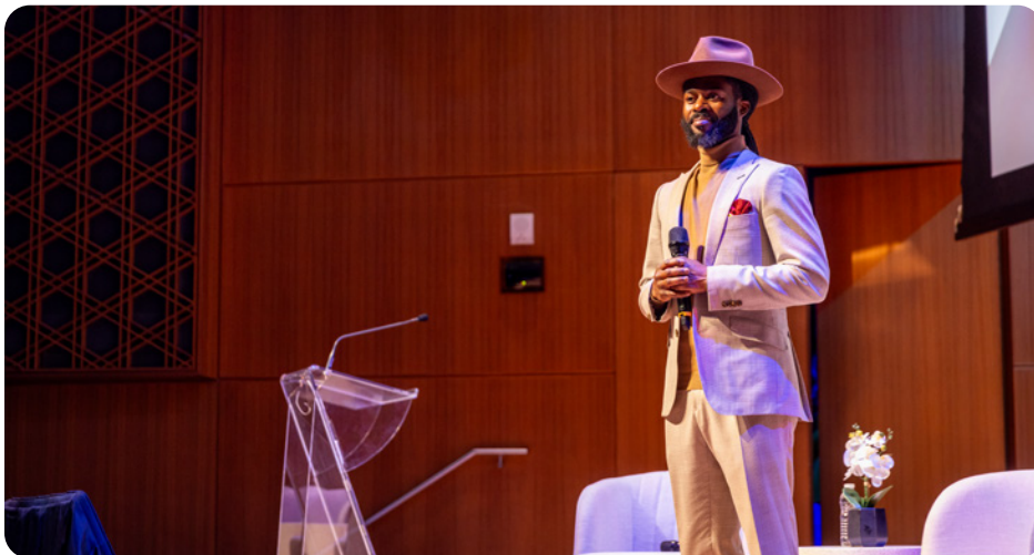
Randell Adjei, adepte de poésie performative et premier poète officiel de l'Ontario